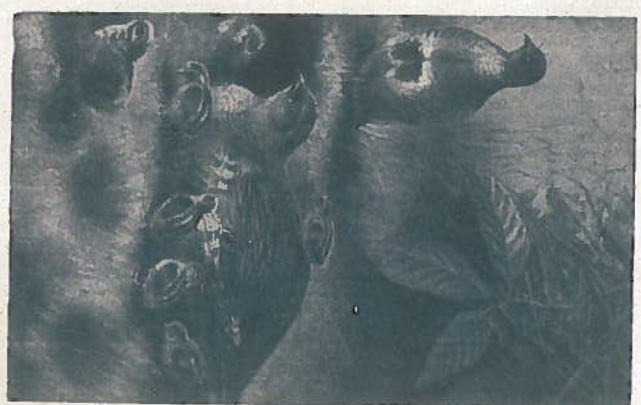
La starna è ancora abbondante sui monti del Gargano.